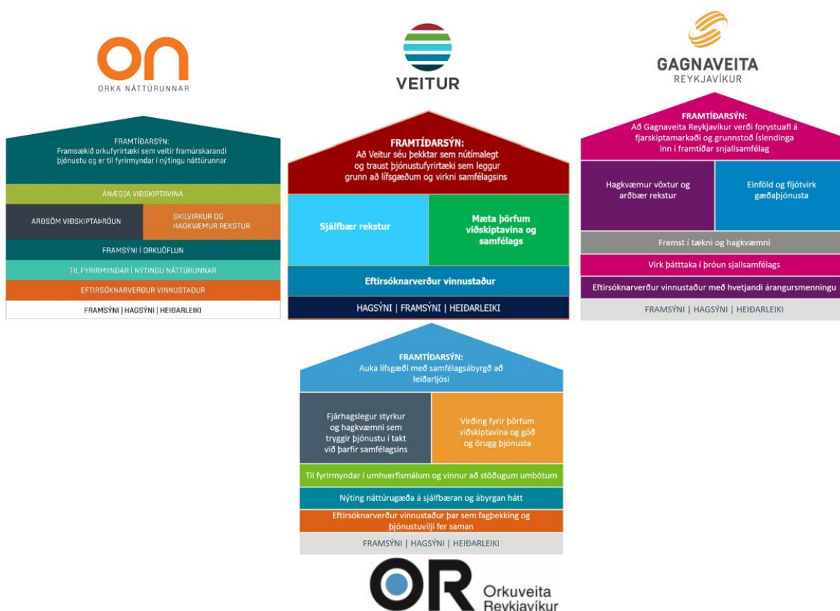
Mynd 1. Myndræn framsetning heildarstefnu OR samstæðunnar og dótturfélaga.

Í eigendastefnu er fjallað um stefnumótunarhlutverk stjórnar OR sem eigendur fela henni. Þar segir „Stjórn skal leggja fram tillögu að stefnumörkun og framtíðarsýn fyrirtækisins með útfærslu á mælikvörðum og greinargerð fyrir eigendafund til staðfestingar.“ 6 Fyrirliggjandi er stefnumörkun í þeim málaflokkum sem eigendastefnan tilgreinir auk þess sem stjórn hefur samþykkt og fylgist með tilteknum lykilmælikvörðum. Eigendafundur hefur ekki fengið framangreint til staðfestingar. Samhliða innleiðingu Beyond Budgeting, og eins og verklag við rýni stefnu markmiða og mælikvarða tilgreinir og fjallað verður um hér á eftir, er unnið að endurskoðun lykilmælikvarða í samstæðunni. Gert er ráð fyrir að leggja tilgreindar stefnur og mælikvarða fyrir eigendafund til staðfestingar á árinu 2018 þegar stefnt er á að innleiðingu markmiðsferlis Beyond Budgeting ljúki. Ellefu lykilmælikvarðar hafa verið í gildi fram til þessa, það eru Planið, sem nú hefur runnið sitt skeið, áhætta, arðsemi, staða auðlinda, opinber leyfi, styrkur brennisteinsvetnis, ánægja viðskiptavina, rekstraröryggi, H-tala, sem er tíðni vinnuslysa, starfsánægja og umfjöllun í